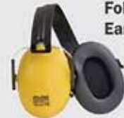
Saviour Foldable Ear Muffs