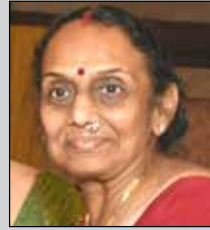
વર્ધાબેન મોતા તા.૨૮ જૂન (ઉ.૫૭) તેરા-દેવલાલી

આ કોલમમાં આપના કુટુંબીજનોને આપ વિનામૂલ્યે શ્રદ્ધાંજલિ આપી શકશો. વિગતમાં આપ નામ, ફોટો, ઉંમર અને હાલ વસવાટની વિગત વિનામૂલ્યે આપવામાં આવશે.