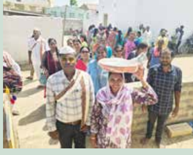
રાપરગઢવાળી ગામે થાળ