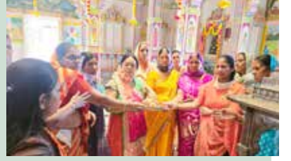
કોઠારા જિનાલયમાં સ્નાત્રપુજા