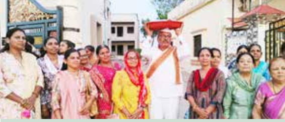
મંજલરેલડીયા ગામે થાળ