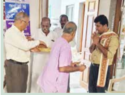
વરાડીયામાં શ્રી સંઘનું બહુમાન