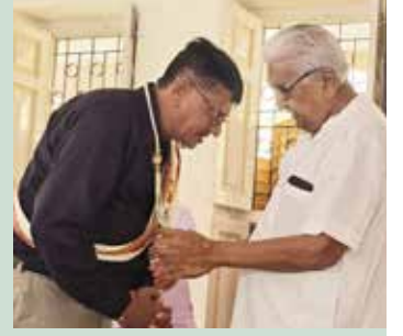
રાયણમાં શ્રી સંઘનું બહુમાન