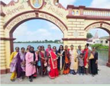
કોઠારા ગામે સમુદ તસ્વીર