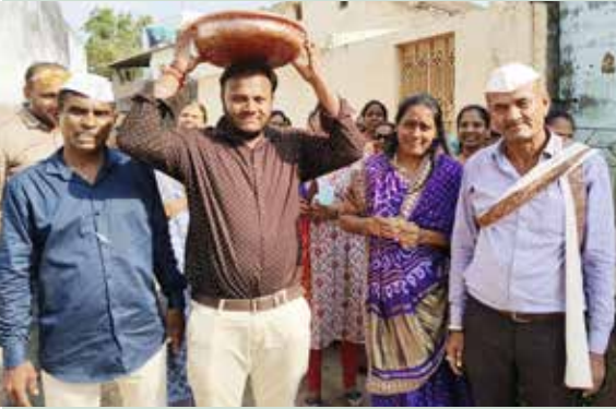
વરાડીયા ગામે થાળ