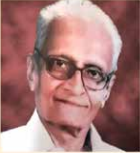
શ્રી મહેશાંત યશ્રભોજ લોડાયા વારાપધર