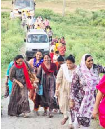
મંજલ રેલડીયા ગામ