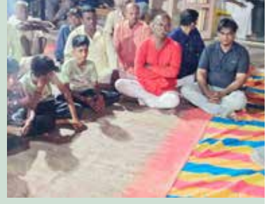
કોઠારામાં રાત્રી ભાવના