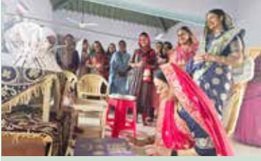
કોઠારા ગામે ગહુલી