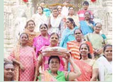
કોઠારા તીર્થે થાળ

શ્રી કચ્છી દશા ઓશવાળ જૈન જ્ઞાતિ મહાજનશ્રી ભુજ દ્વારા ચૈત્યપરિપાટી યોજાઈ હતી. ઢોલ-શરણાઈનાં નાદો તથા ધાર્મિક સુત્રો સાથે જિનાલયોનાં દર્શન, પૂજ્ય ગુરુભગવંતોને વંદન સાથે વિવિધ કાર્યક્રમો યોજાયા હતા. ગામો-ગામ શ્રી સંઘનું વાજતે-ગાજતે સામૈયું કરવામાં આવેલ. જિનાલયોમાં ચૈત્યવંદન યોજાયા હતા.