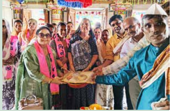
સાંધવ ગામે થાળ