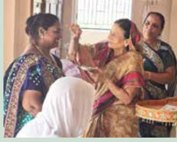
બાડામાં શ્રી સંઘનું બહુમાન