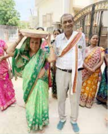
બાડા ગામે થાળ