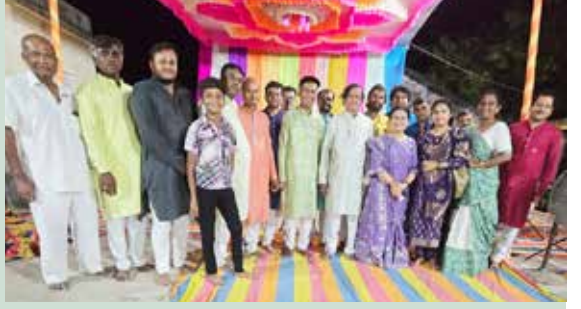
રાત્રિભાવનાઓમાં કાલાકારો સાથે