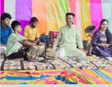
કલાકારો સાથે તબલાવાદક કનિષ્ઠ શાલ