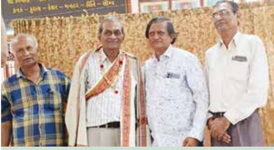
માંડવીમાં શ્રી સંઘનું બહુમાન