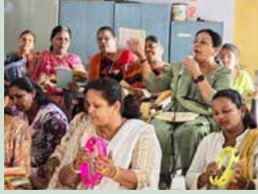
કોઠારા ગામે મહાકાળી માતાજીની ભાવના