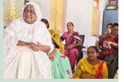
પુ.સા.શ્રી જયધર્માશ્રીજી મ.સા.