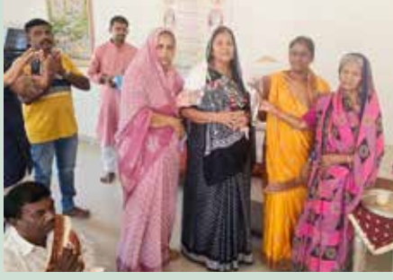
સાંઘવમાં શ્રી સંઘનું બહુમાન