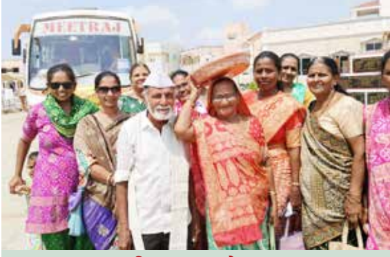
શિવમસ્તુ મધ્યે થાળ