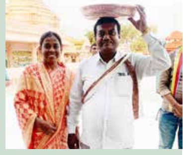
સુથરી મહાતીર્થે થાળ