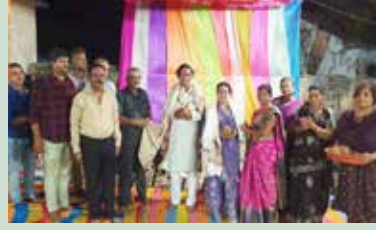
કોઠારા ગામે મહાજનશ્રી દ્વારા બહુમાન