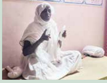
પુ. સા. શ્રી કાવ્યગુણાશ્રીજી મ.સા.