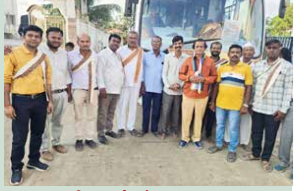
શ્રી ક.દ.ઓ. જૈન મહાજન ભુજ