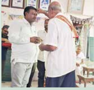
સુથરીમાં શ્રી સંઘનું બહુમાન